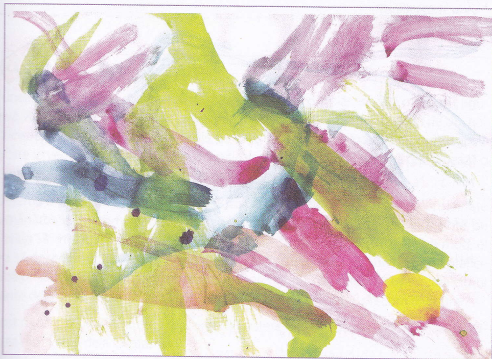
4. Experiențe de pictură realizate de Robinson la 2 o ani.