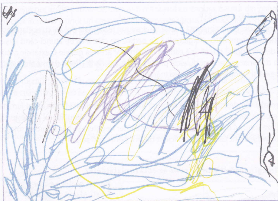
3. Umplerea spațiului realizată de Robinson la 2 o ani.

La început, ochiul nu poate decât să urmărească mâna care deplasează rapid creionul și să descopere imediat rezultatele. Pe la doi ani și jumătate, ca urmare a încetării gestului, mâna încearcă să asculte de ochi. Această inversare a raporturilor ochi/mână schimbă totul. De altfel, copilul dumneavoastră este din ce în ce mai concentrat să-și ghideze mâna.